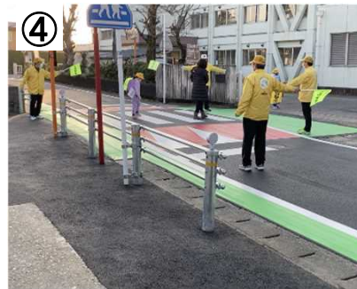
登下校時の見守り活動