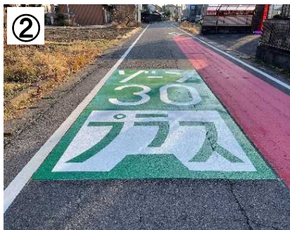
ゾーン30プラス路面表示