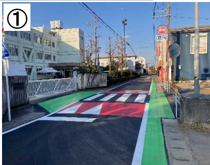
スムーズ横断歩道