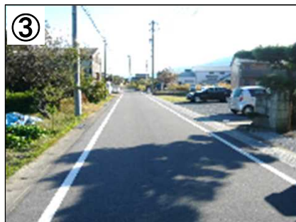
③ クランク設置(予定)