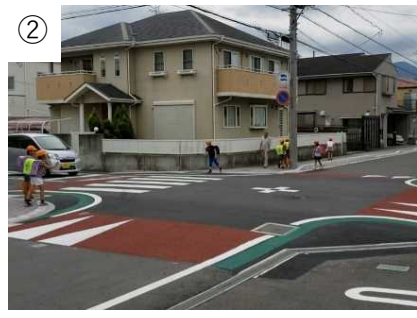
スムーズ横断歩道