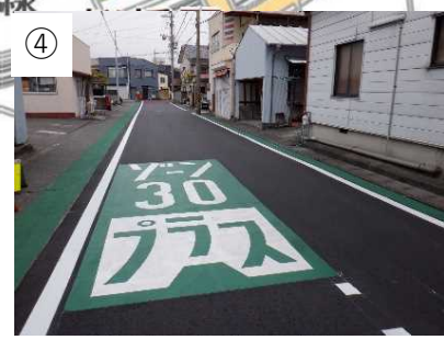
カラー舗装、路面表示

※ 今後、実施した対策の効果検証を行い、更なる対策の必要性等について検討していきます。(P D C Aサイクルの継続的な取組)