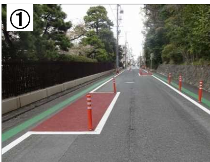
シケイン (クランク型)