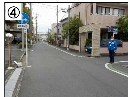
登下校時の見守り活動