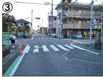
歩行空間整備(カラー舗装)