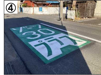
ゾーン30プラス看板・路面表示