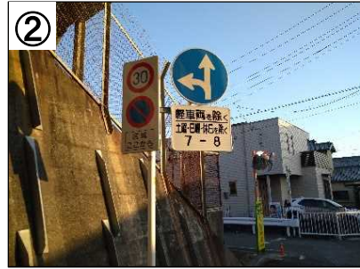
指定方向外進行禁止規制 (7-8:00・土日除く)