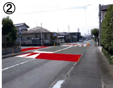
② ハンプ【予定(イメージ)】