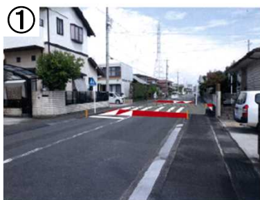
① ハンプ【予定(イメージ)】