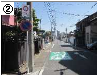
ゾーン30プラス看板・路面表示