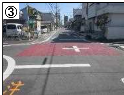
カラー舗装(交差点)