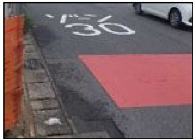
対策済みカラー舗装及びゾーン30プラス看板・路面表示(予定)