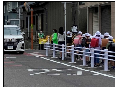
登下校時の見守り活動