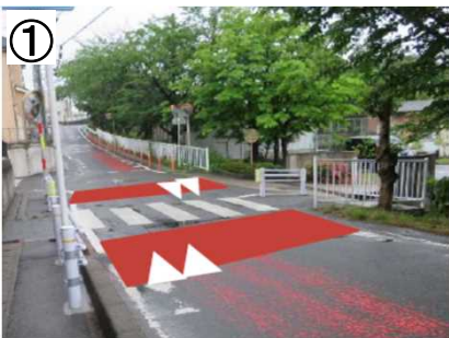
スムーズ横断歩道(予定)・防護柵