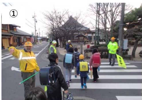
登下校時の見守り活動