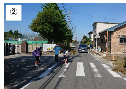
登下校時の見守り活動