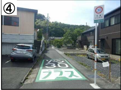
ゾーン30プラス路面表示