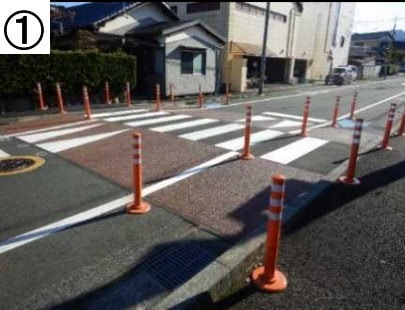
スムーズ横断歩道