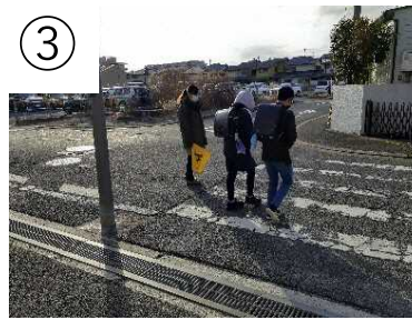
登下校時の見守り活動