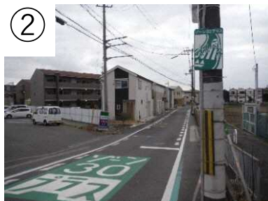
ゾーン30プラス看板・路面表示