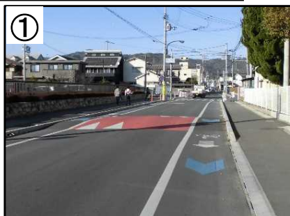
① ハンプ・路側帯拡幅