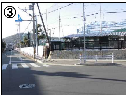
③ 防護柵(ガードパイプ、横断防止柵)