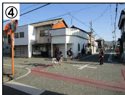
④ 登下校時の見守り活動