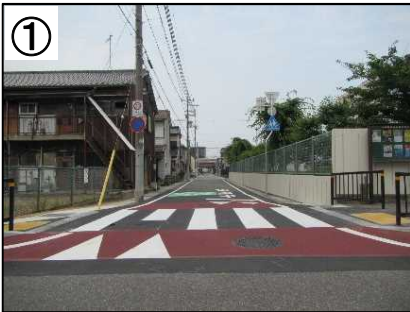
スムーズ横断歩道