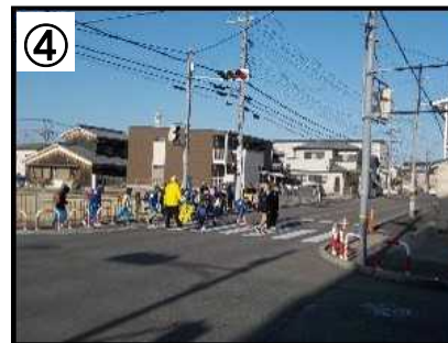
登校時の見守り活動