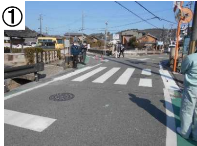
① スムーズ横断歩道 (予定)