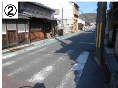
② カラー舗装 (予定)