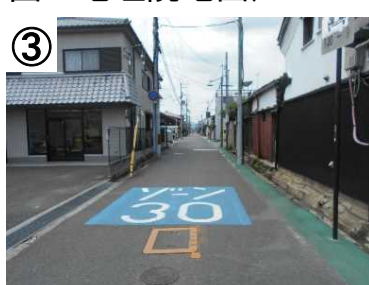
③ ゾーン30プラス路面表示 (予定)