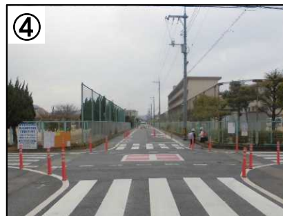
交差点路面表示・交差点狭さく