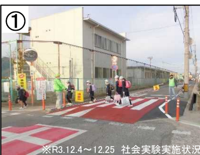
※R3.12.4~12.25 社会実験実施状況 スムーズ横断歩道【予定】