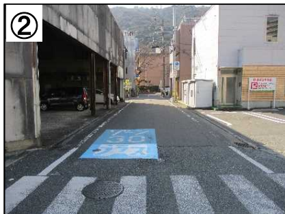
ゾーン30プラス路面表示