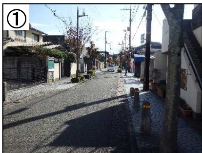
シケイン(クランク型)