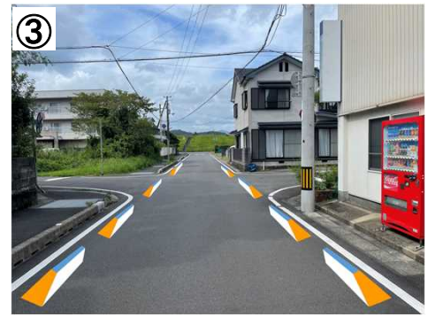
イメージハンプ【予定(イメージ)】