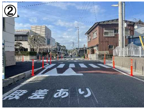
スムーズ横断歩道(交差点部)