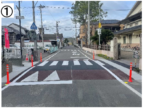
スムーズ横断歩道(単路部)