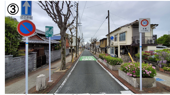
ゾーン30プラス看板・路面表示、一方通行