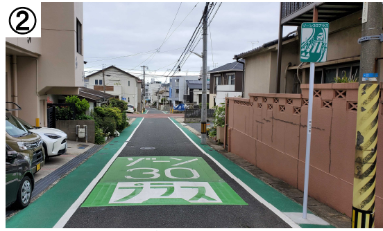
ゾーン30プラス看板・路面表示