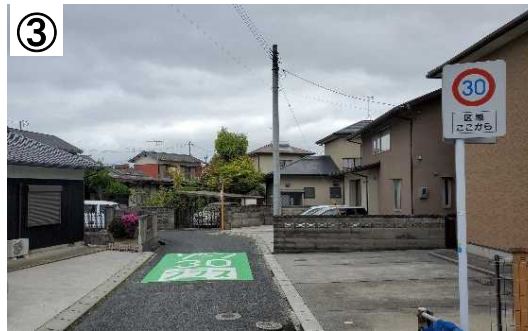
ゾーン30プラス路面表示