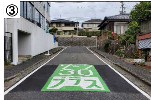
ゾーン30プラス看板・路面表示