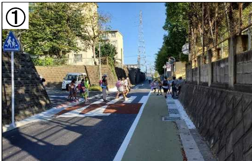
スムーズ横断歩道、登下校時の見守り活動