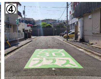
ゾーン30プラス看板・路面表示