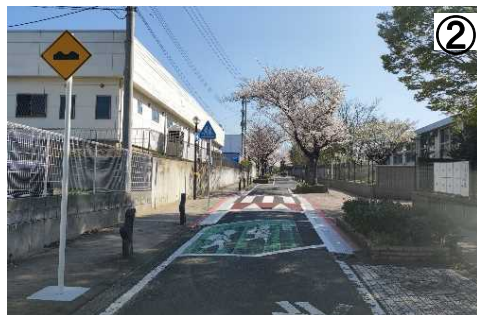
スムーズ横断歩道、シケイン(クランク型)