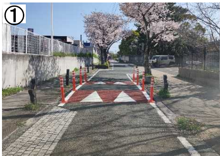
ハンプ、シケイン(クランク型)