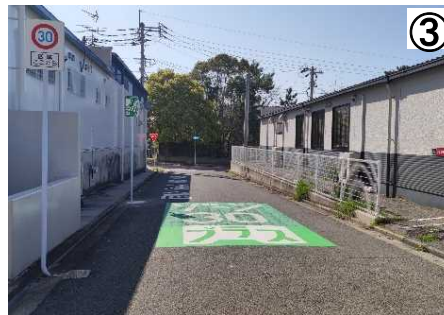
ゾーン30プラス看板・路面表示