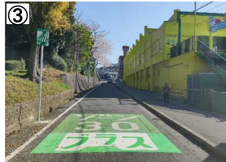
ゾーン30プラス看板・路面表示