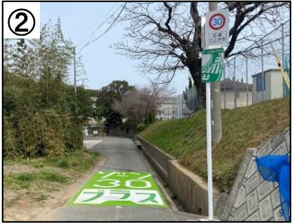
ゾーン30プラス看板・路面表示