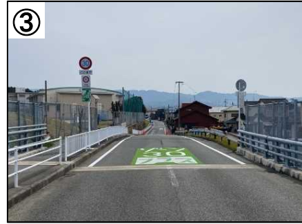
ゾーン30プラス看板・路面表示