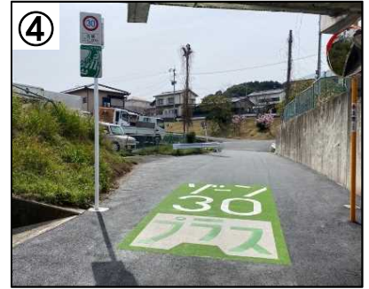
ゾーン30プラス看板・路面表示