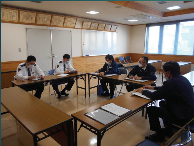
交通規制に関する教養状況