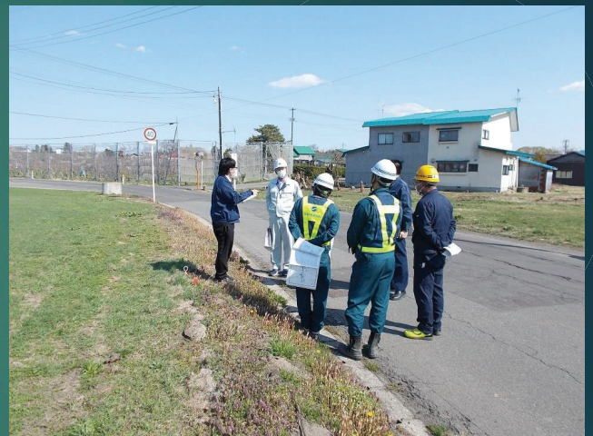
道路協議の支援状況