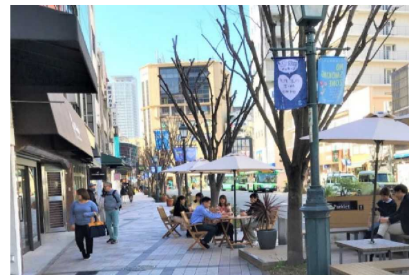
賑わいの場としての道路

道路は、地域・まちの骨格をつくり、環境・景観を形成し、日々の暮らしや経済活動等を支える環境を創出します。