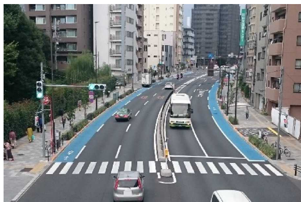
日常的な移動を支える道路