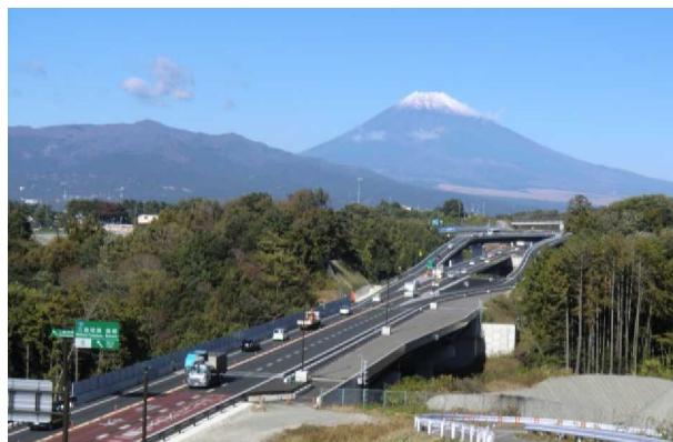
広域的な移動を支える道路

道路は人や地域を相互につなぎ、日常生活や観光等の人の移動と生活物資や農林水産品、工業製品等のモノの輸送を支えます。