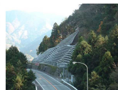
法面・斜面の防災対策