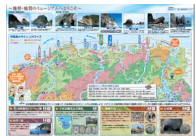
(風土地質散策マップ：兵庫県)