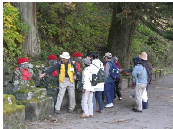
憾満ヶ淵・化け地蔵コース