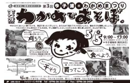
(わかめであそぼチラシ：香美町)

香美町推進協議会では、地域の名物である新ワカメを刈り取ったり干したりする実体験イベントを、平成20年度からゴールデンウィーク中に3年間継続しており、来客者数が年々増加しています。