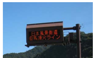
(但馬漁火ラインPR：兵庫県)

兵庫県但馬県民局では、「日本風景街道 但馬漁火ライン」知名度向上に向けて、イベント時に道路情報板でPRを行っています。