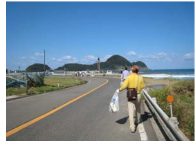
(ウォーキングイベント：豊岡市)

豊岡市推進協議会では、平成21年度ウォーキングアンドクリーンアップイベントを開催し、つつい車で通過しがちな但馬漁火ラインルートをゆっくりとウォーキングし、同時に清掃し美化しました。