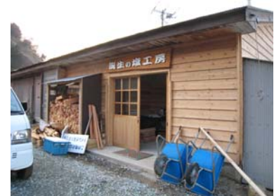
(塩づくり体験施設：豊岡市)

豊岡市推進協議会では、たけの観光協会が塩づくり体験施設(誕生の塩工房)を平成20年度にオープンし、学校の体験実習や観光客に対して、塩づくりやその塩を使っておにぎりづくり干し魚づくりなどの体験イベントを提供しています。年々利用者が増加しています。