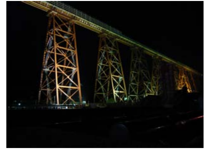
(ライトアップ：香美町)

香美町推進協議会では、日本一の高さを誇るトレスル式鉄道橋梁「余部鉄橋」が平成22年8月12日に新橋梁(コンクリート製)に架け替えられることとなり、その雄姿を残すため、平成19年に夜間ライトアップを実施しました。