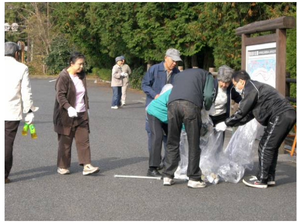
日光杉並木での清掃活動

勉強会では必ず参加者アンケートを実施していますが、その結果では多くの方が歴史の深さに感銘を受け、またボランティアの方々の知識の多さに驚いています。さらに勉強会の継続を望み、風景街道としての活動にも賛同していただいています。