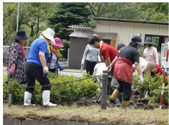
いろは坂での清掃活動