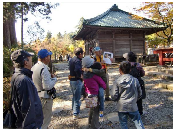
滝尾神社・中世の古道コース