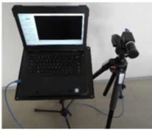
図1 計測システムの基本構成