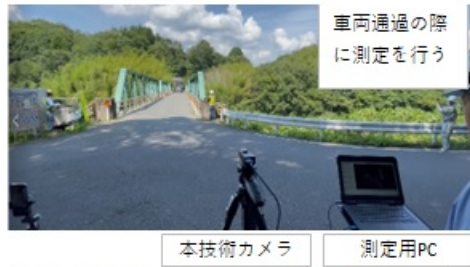
図2 本技術を用いた固有振動測定の実イメージ