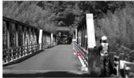
図4 映像内で解析箇所を選択する(赤四角部分)