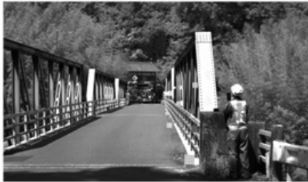
図3 本技術で撮影した映像