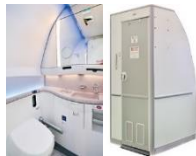
化粧室(ラバトリー)