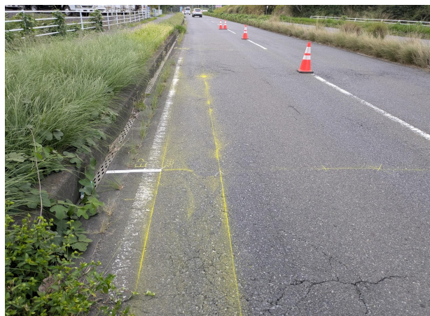
※写真は正解値測定時（交通規制中）