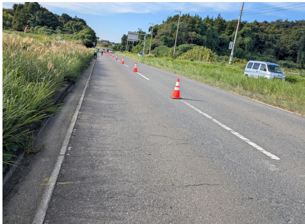
※写真は正解値測定時（交通規制中）