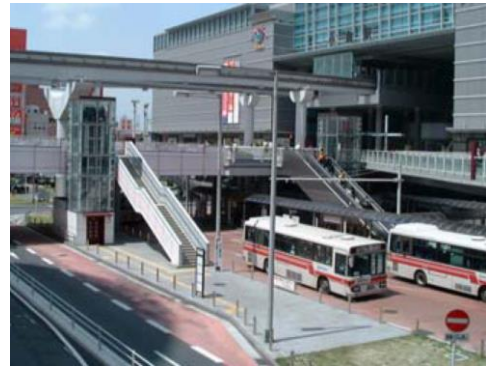
駅前広場におけるエレベーターや 円滑に乗降できるバス停の整備