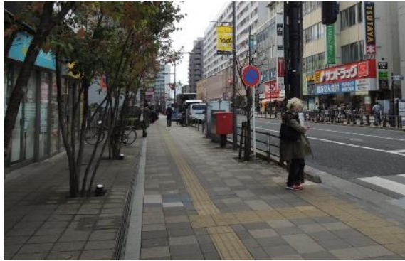
幅の広い歩道の整備や 視覚障害者誘導用ブロックの整備

高齢者や障害者等を含め全ての人が安全に安心して参加し活動できる社会を実現するため、平成18年12月に施行された「バリアフリー法※」を踏まえ、駅、官公庁施設、病院等を結ぶ道路や駅前広場等において、幅の広い歩道の整備、歩道の段差・傾斜・勾配の改善、無電柱化、視覚障害者誘導用ブロックの整備等により、歩行空間のユニバーサルデザインを推進する。