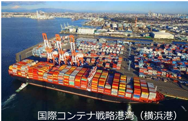
国際コンテナ戦略港湾（横浜港）