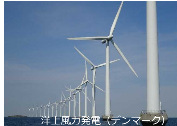
洋上風力発電（デンマーク）