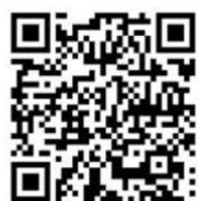
総合職技術系 採用HP

HP : https://www.mlit.go.jp/page/kanbo08_hy_000086.html