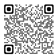
建設機械・施工 採用HP