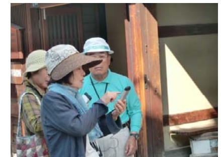
移動支援サービスの 体験風景