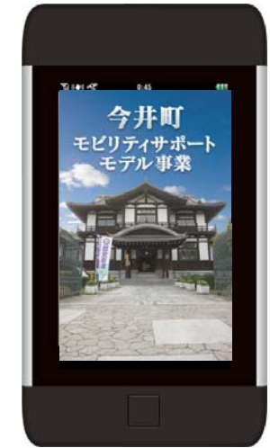
UC(ユビキタスコミュニケーター)の トップ画面

散策ルート ●●●●● 重要文化財めぐりルート(長時間コース/約2時間) ●●●●● 町並みめぐりルート(短時間コース/約40分)