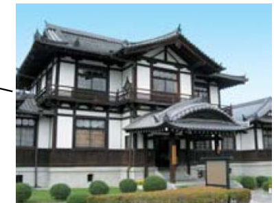
UCの貸出・返却場所 (今井まちなみ交流センター「華薨」)