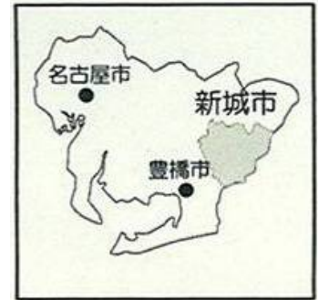
図一愛知県新城市位置図

さらに、少子化に伴う学校の統廃合が進み、学童の通学手段としてのバスの必要性和合わせて、人口に占める高齢者の割合も年々高まっており、高齢者の移動手段確保という意味においても、バスの必要性が高まっています。