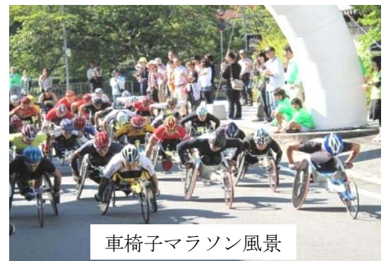
車椅子マラソン風景