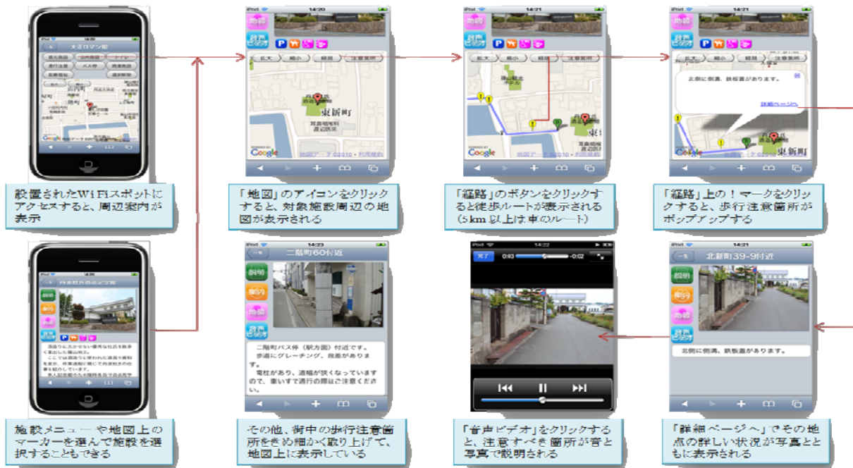
サービス提供の流れ

なお今回の実証実験では、特に WiFi 測位技術の精度確認を重点的に行いました。実証実験の前に GPS と WiFi 測位を行える機器を搭載した自動車地区内を走行 (War Driving) し、そのデータをアップロードしていくことで、WiFi 測位の精度は、War Driving 実施前の 20~30m の測位誤差が市街地内で 5m 程度の誤差にまで縮小することが明らかになりました。WiFi 測位技術は、屋外でしか使えない GPS に比較し、屋内や建物の陰になる場所でも利用できるため、歩行者の移動支援には効果的であることが明らかになりました。