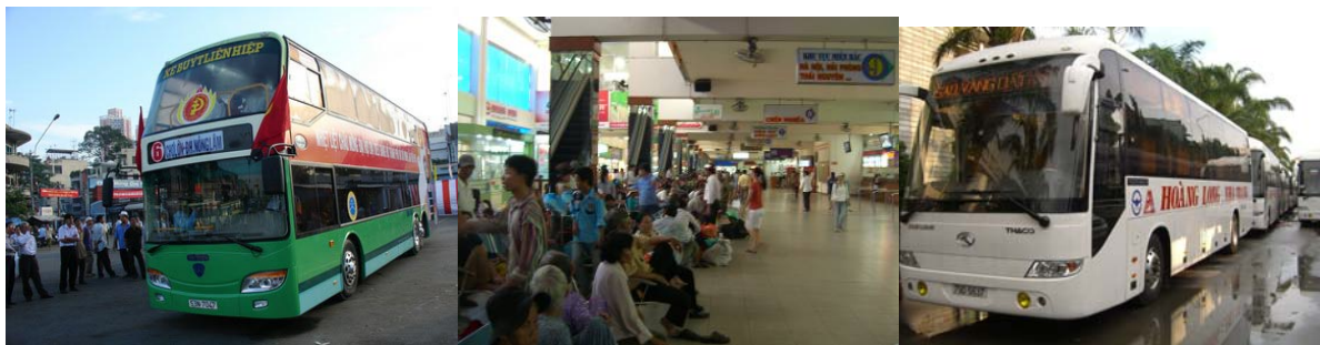
写真6 (左から) 二階建てバス (路線バス)、長距離バスターミナル、長距離用バス