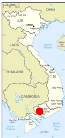
図1 ホーチミン市の位置と形状

ベトナム国は、人口約87百万人（2008年）、面積33万km 2 であり、人口はわが国より少ないものの、面積、細長い形状は良く似ています。その中で、ホーチミン市は、人口約717万人（2009年）、毎年約20万人が増加し、2025年には、1,000万人のメガロポリスになろうとするベトナム最大の商都で、今でもフランス占領時代の建物が残る美しい街です。市の名前の由来は、ベトナム独立の父と言われる“ホーチミン”ですが、旧名称は“サイゴン”で、こちらの方がなじみのある方が多いのではないのでしょうか。