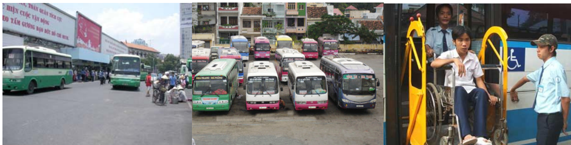
写真5 (左から) バスターミナル風景、障害者用リフト付バス

現地でのバスに関するレポート、新聞などによるとバス路線の案内が分かりにくい、バスが遅れるなどで利用者が減少気味であるとの指摘もあります。ホーチミン市がこれから1,000万人のメガロポリスとして、持続可能で環境にやさしい都市として成長するためには、公共交通である路線バスサービスの充実が急務であり、せっかく車両のハード面は充実しつつあるなか、世界の都市で導入が始まっているBRT (Bus Rapid Transit) などの導入、ソフト面での充実が進むことが望まれます。