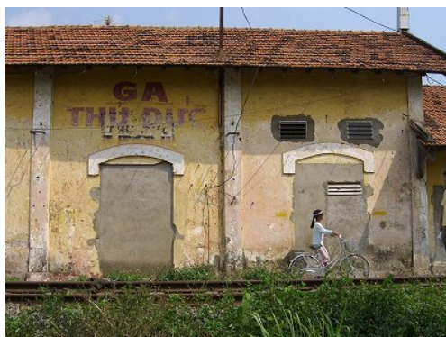
写真7 ホーチミン市郊外の鉄道路線

現在、ホーチミン市内にはホーチミンとハノイを結ぶベトナム鉄道の路線だけがあります。一方、都市内鉄道は6つの都市内高速鉄道路線が構想・計画されています。その中の地下鉄1号線が、2016年にベトナムではじめての都市内高速鉄道として、日本のODAで事業が進んでいます。(開業時点は現時点での予定です)。ホーチミン市が成長を続けるために実現が期待されるところです。