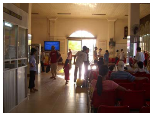
写真8 中部地域フエ駅で列車を待つ人々