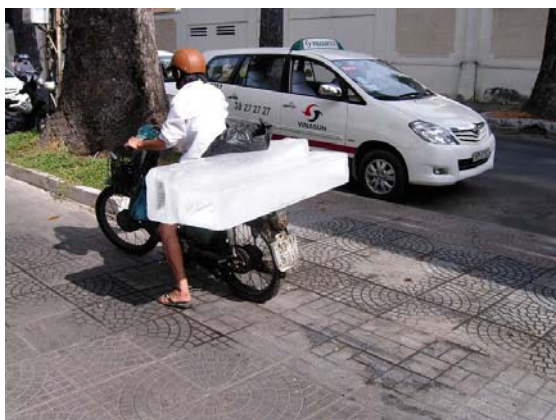
写真3 氷を荷台に乗せているバイク

バイクは単なる移動手段だけではなく、週末のデート、夕方の夕涼みなどで利用されることも多く、金曜日の夕方、クリスマス、バレンタインデーなどはさらに多くのバイクに乗った人がまちなかにあふれ、まさに生活そのもの、幸せと一緒に動くバイクと言っても良いでしょう。