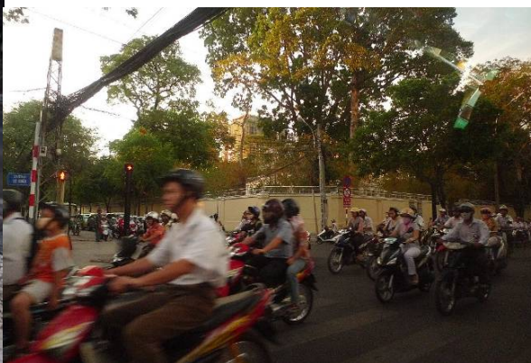
写真4 夕方の市内の風景