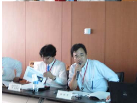
第5回勉強会(H23.6.20開催)の様子