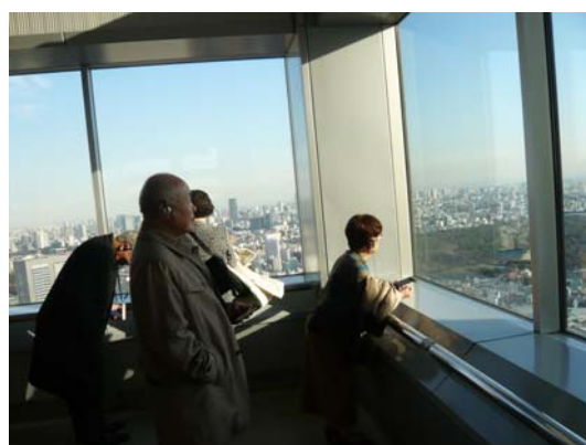
西新宿エリア（都庁展望室）での実験風景