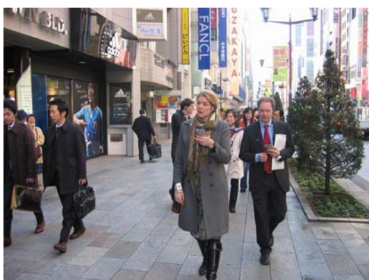
銀座エリア（銀座通り）での実験風景

東京都では10月から、宿泊客等に専用の携帯情報端末を貸し出し、銀座エリア及び西新宿エリアにおいて店舗情報や観光情報などを提供する予定です。また、ユビキタス技術を活用した情報提供を継続的に実施していくため、都を構成員に含む「東京ユビキタス計画・銀座」実施協議会において、民間が主体となる運用体制の構築と情報提供機器や情報の法的位置付けについて、それぞれ検討することとしています。平成18年度から実証実験に取り組んできた実績を踏まえ、官民協同運用体制の構築を目指した確実な取組が期待されています。(Y. S.)