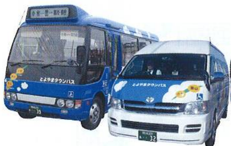
とよやまタウンバス

豊山町では、バス利用者の利便性や満足度を向上させるために、自らの行政区域内にとられないニーズの把握や路線の設定・見直し、民間バス事業者等関係者との連携による乗継停留所の新設や「豊山町公共交通マップ」の作成、「グループインタビュー」や現地調査の実施による徹底した住民ニーズの把握などの取組を継続的に行っています。このように、持続可能な交通の確保に向けた地域密着型コミュニティバスの取組について、豊山町から紹介頂きます。