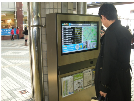
駅改札前に設置された 「バス乗り継ぎ情報提供表示システム」