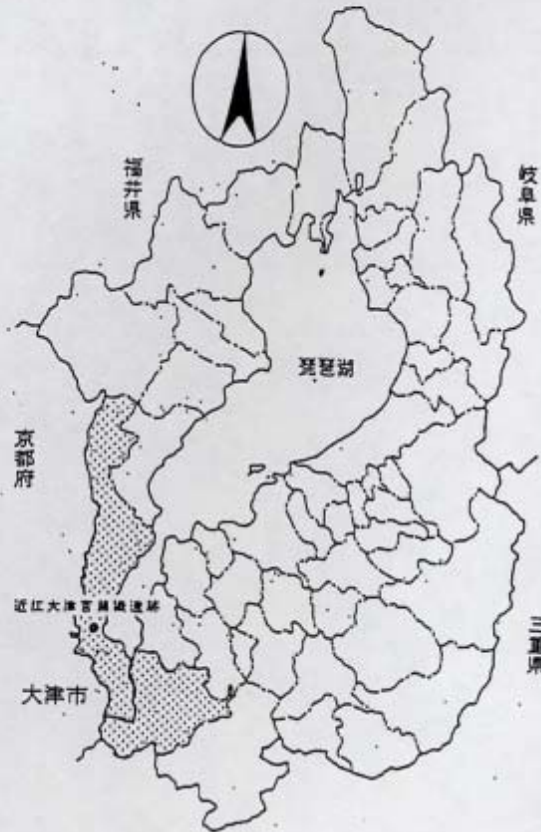
滋賀県大津市の位置