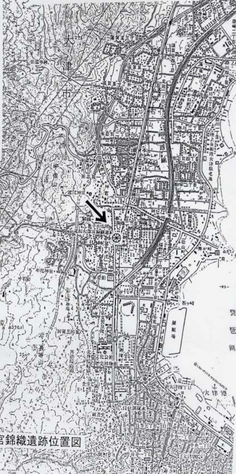
近江大津宮錦織遺跡位置図