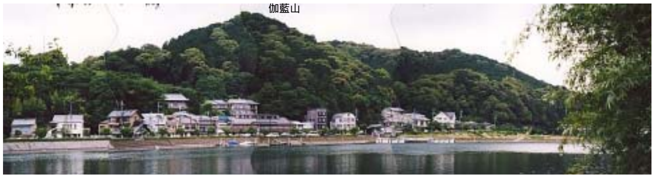
がらんやま 伽藍山の樹林地及びその前面の瀬田川