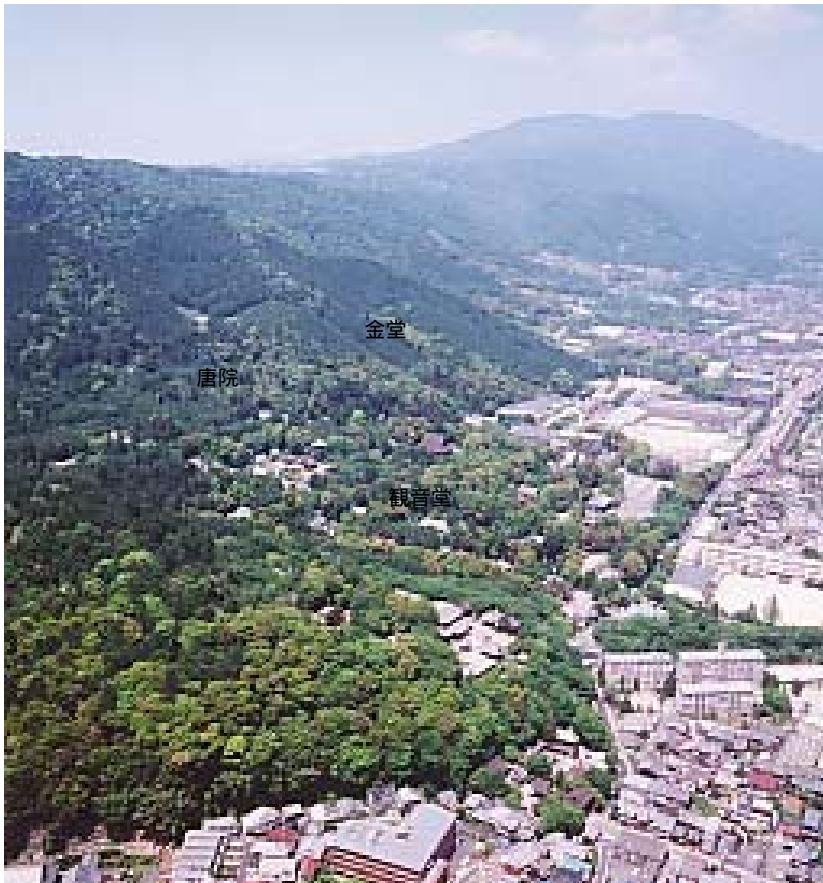
ながらやま 長等山の樹林地