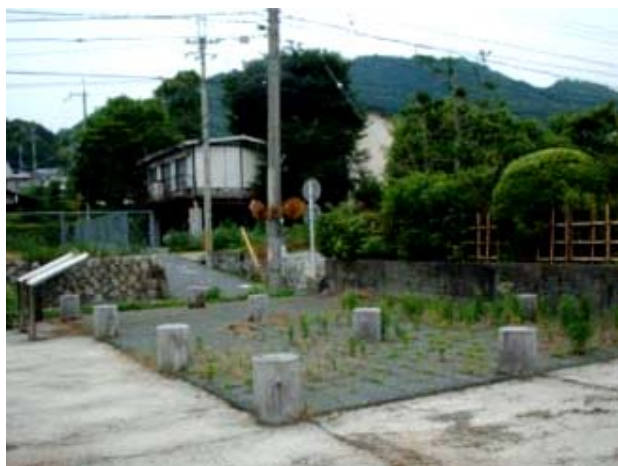
近江大津宮錦織遺跡の整備状況