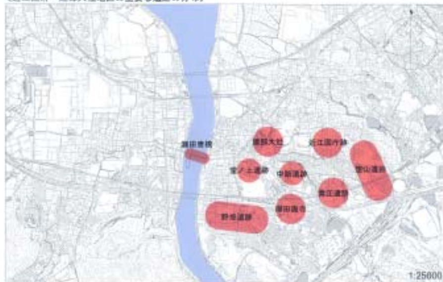
〔近江国府・建部大社地区の主要な遺跡の分布〕