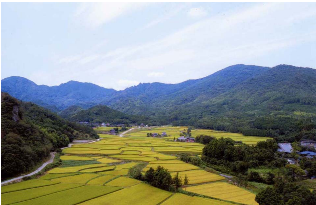
大分県豊後高田市