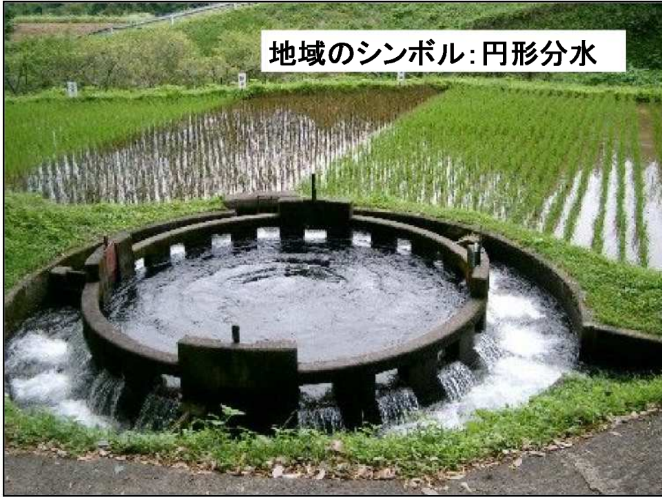
地域のシンボル:円形分水