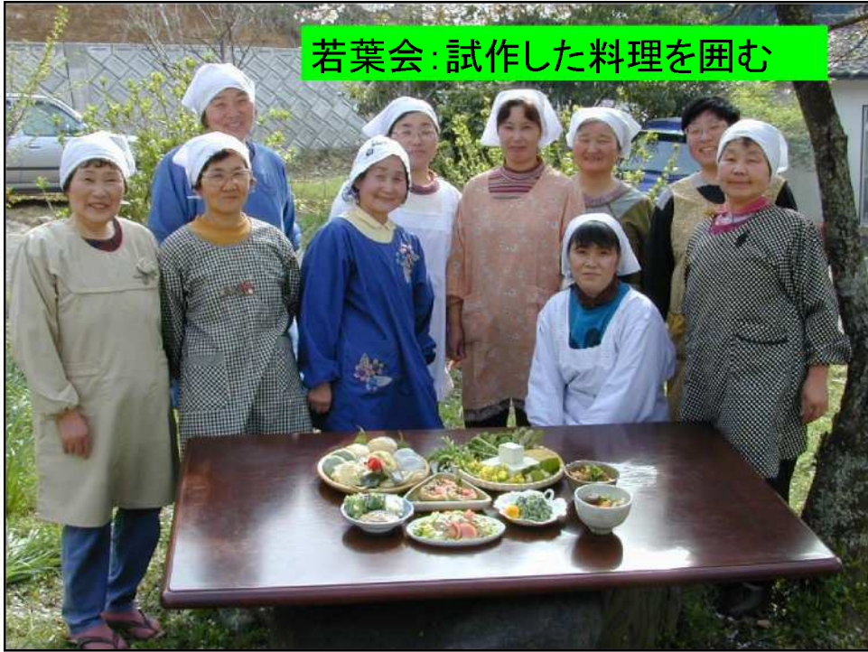
若葉会:試作した料理を囲む