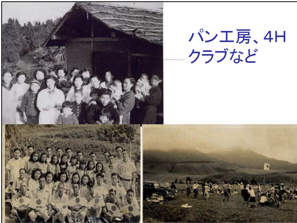
パン工房、4H クラブなど