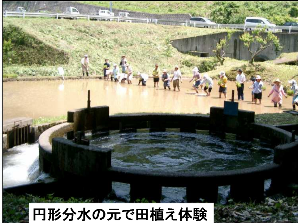
円形分水の元で田植え体験