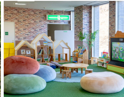
(廊下→キッズエリア)