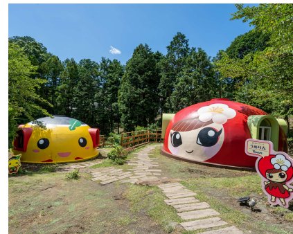
(事業者によって新設された宿泊施設)